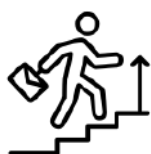
自己成長への渴望