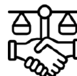
効果的に対立を管理する