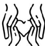
共感と思いやりを示す能力