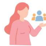
自分より他人の喜びを過度に優先