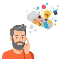
自信喪失を見直す

ネガティブなセルフトークを認識し、疑問を持ち、見直すことで、自分を抑え込まないようにする