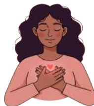
セルフ・コンパッションを 実践する

ネガティブなセルフトークを認識し、疑問を持ち、見直すことで、自分を抑え込まないようにする