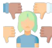
インポスター症候群