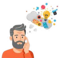
转变自我怀疑心态